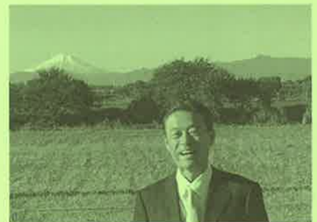
11月12日(火)AM7:00 富士山が裾野まで白く雪化粧をした姿を望む

朝晩が寒くなって参りましたね。今日も元気でお過ごし下さい。今朝は、富士山が綺麗に見えましたので一枚。昨日は、地域の皆さんの声を聴いて参りました。様々な想い、様々な暮らしに添えるような活動をして参ります。